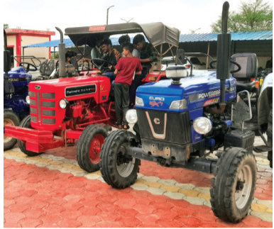
हरिभूमि न्यूज | राजगढ़

चोरी के माल को एक नंबर में करने राजस्थान आरटीओ की संलिप्तता भी उजागर